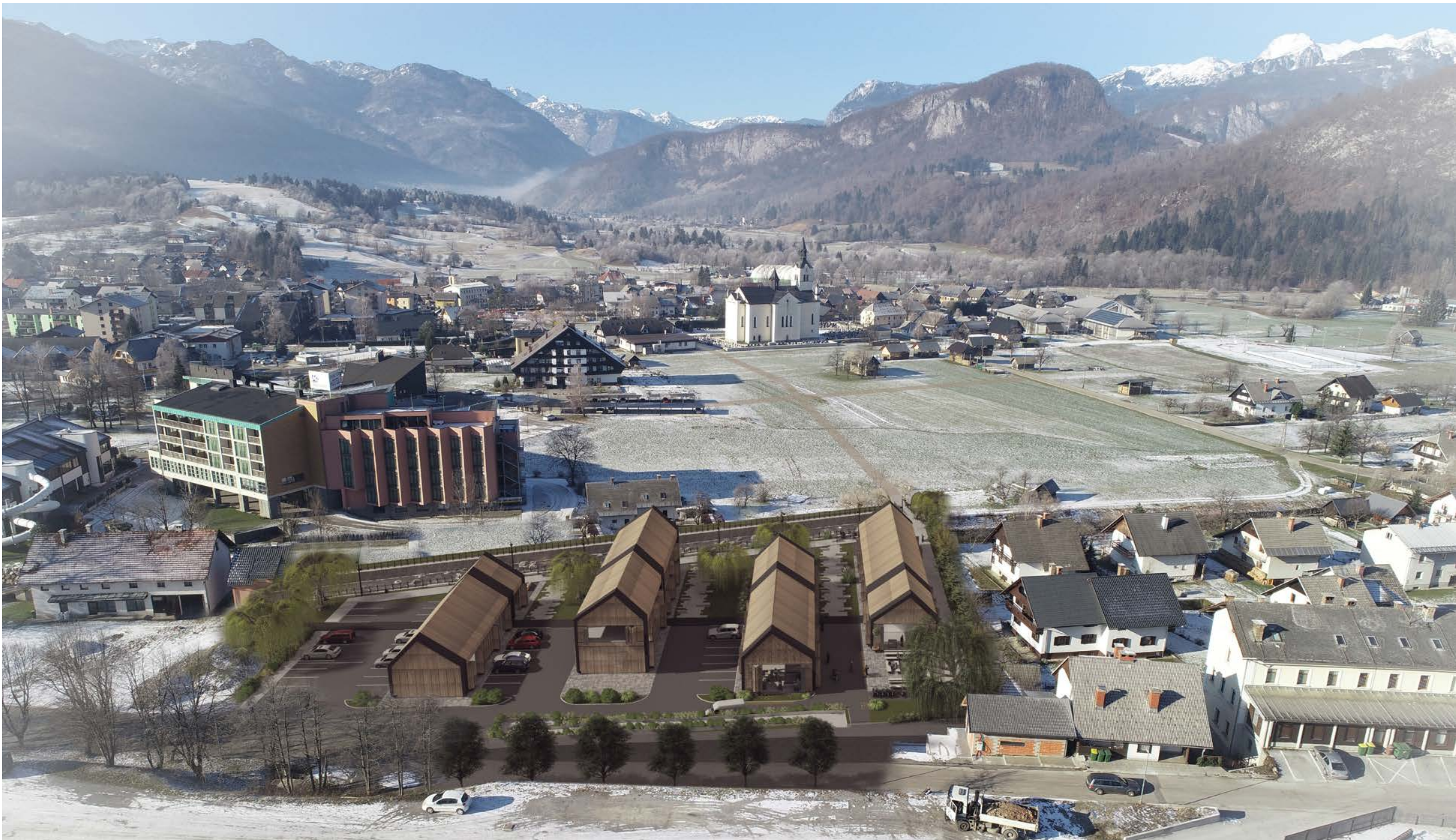
POGLED NA CELOTNO UREDITVENO OBMOČJE