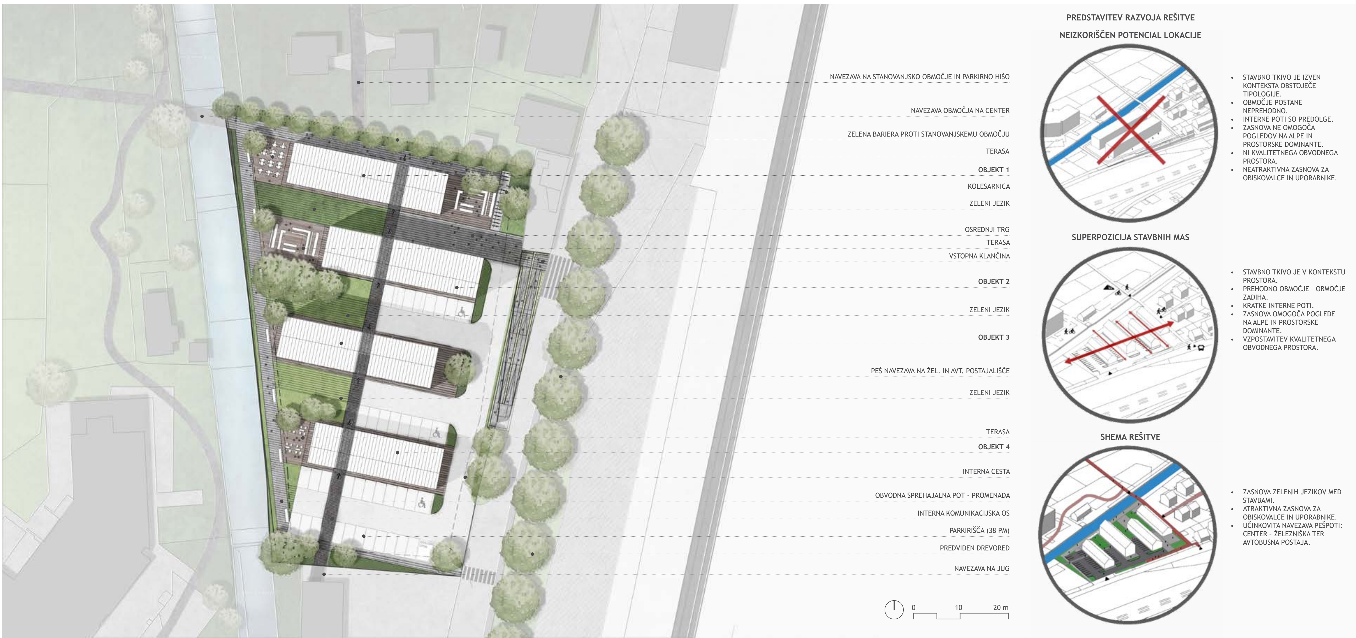
UREDITVENA SITUACIJA OŽJEGA OBMOČJA