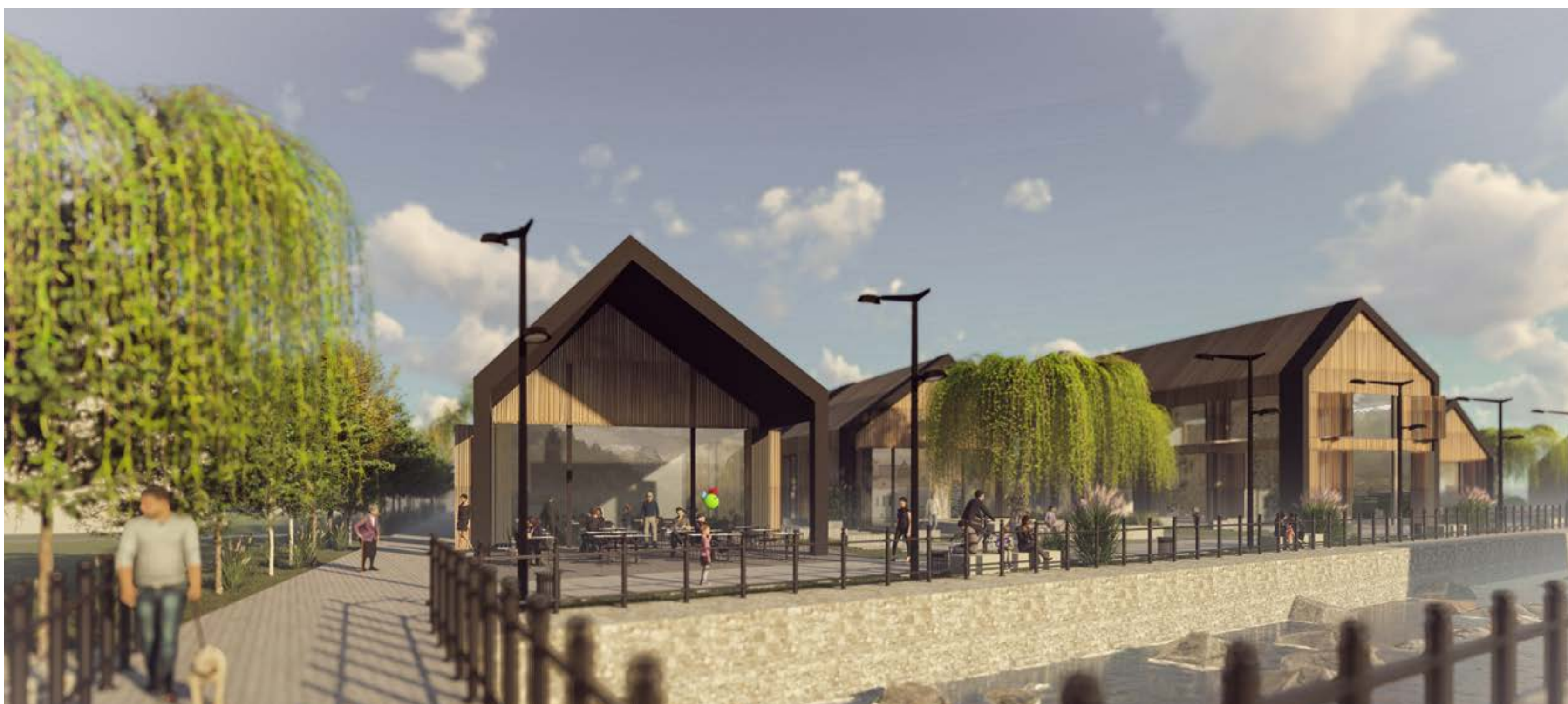
POGLED Z NOVO PREDVIDENEGA MOSTU ČEZ POTOK BELICO