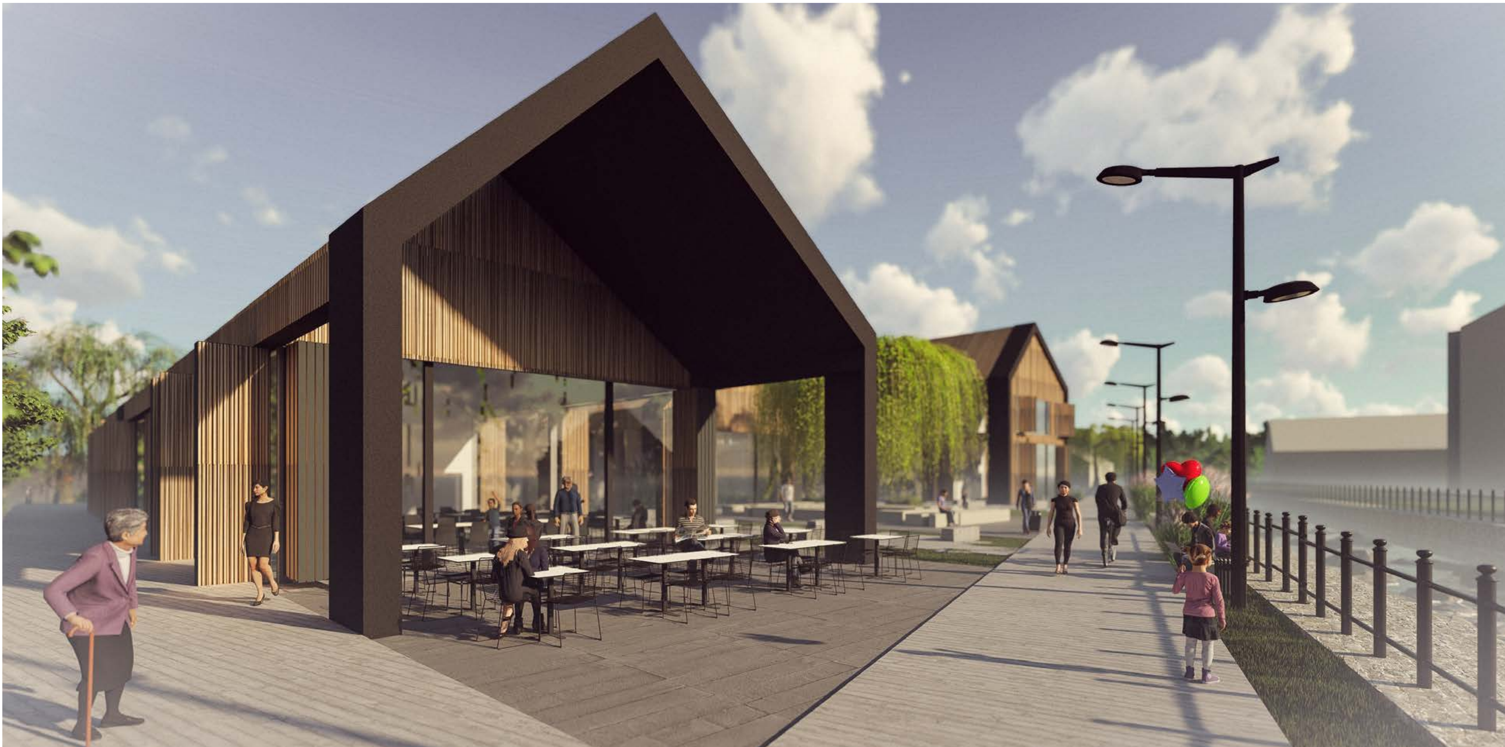
POGLED VZDOLŽ POTOKA BELICA