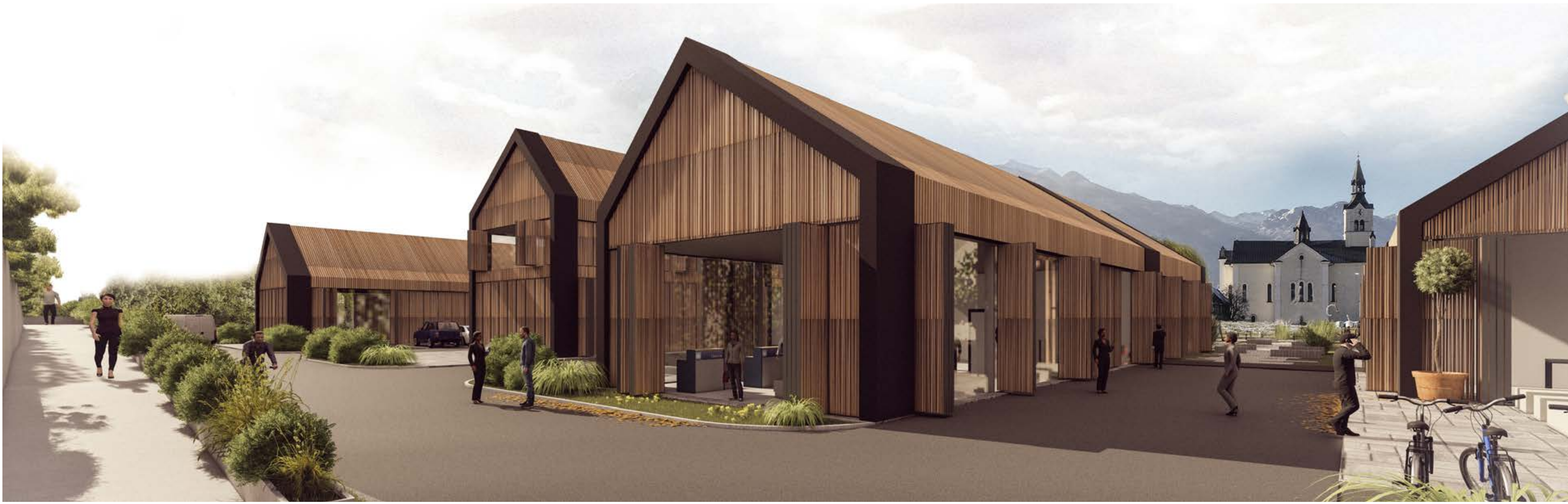
POGLED PROTI CERKVI SV. MIKLAVA